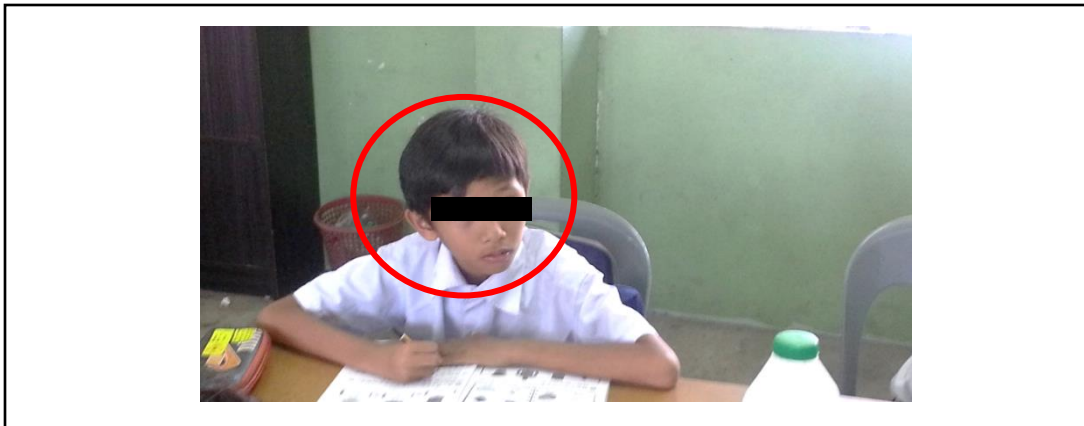
Rajah 5. Murid Charlie berfokus mendengar ajaran guru