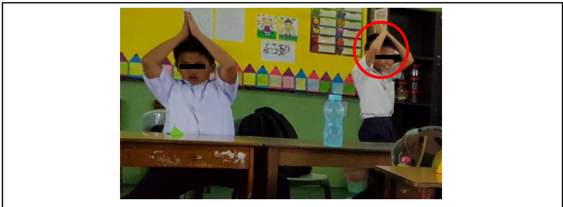
Rajah 4. Murid Bob sedang menari dengan mimik muka gembira