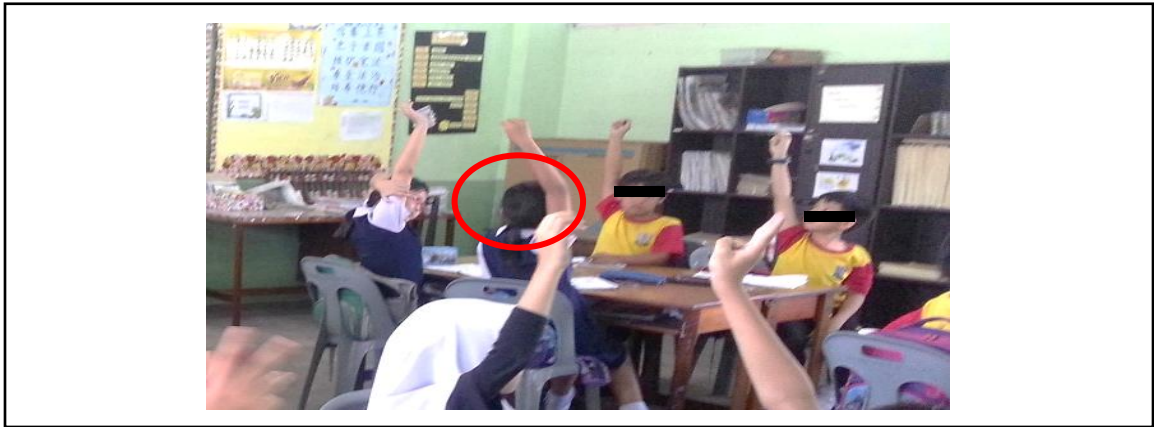
Rajah 3. Murid Amy mengangkat tangan meneka aksi berkaitan lirik

Menurut Rajah 3, 4 dan 5, minat ketiga-tiga peserta kajian terhadap PdP topik Gigi Manusia telah meningkat selepas strategi lagu dilaksanakan. Ia boleh diperhatikan melalui tingkah laku, ekspresi dan mimik muka.