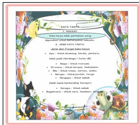
Rajah 3. Maksud dan jenis kata tanya dan fungsi.