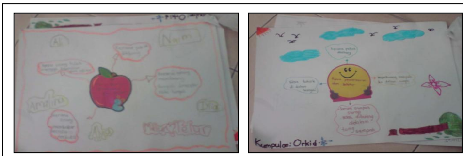
Rajah 10. Hasil kerja murid setelah konsep peta minda diperkenalkan. (16 April 2012).

Sebagai bakal guru Bahasa Melayu, penyelidikan tindakan ini dapat menambah baik amalan pengajaran saya sebagai guru Bahasa Melayu. Selain melaksanakan tindakan ini ke atas peserta kajian, saya turut mengaplikasikan kaedah ini kepada seluruh kelas 4 Matahari. Rajah 10 menunjukkan antara hasil kerja murid setelah saya memperkenalkan kaedah peta minda kepada kelas ini.