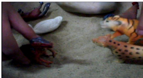
Gambar 2: Satu pergaduhan melibatkan harimau belang dan harimau bintang dengan binatang lain. Rusa mempunyai akal untuk mengalahkan dua binatang tersebut.