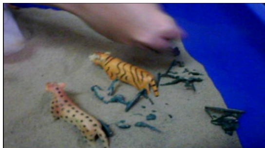
Gambar 3: Akhirnya, semua binatang dan hanya seorang askar yang hidup

tiada orang yang dapat membantu dirinya dan keinginannya untuk berbaik dengan murid tersebut tidak akan tercapai.