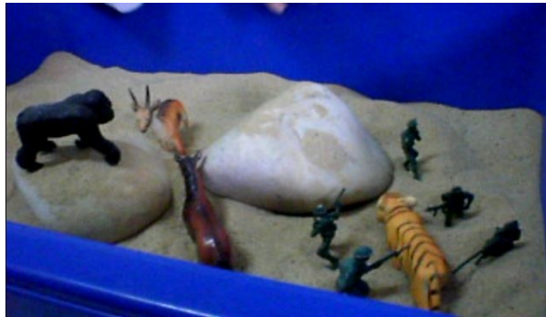
Gambar 1: Quratulani mengandaikan dirinya seperti seekor rusa yang pintar berbanding dengan binatang yang lain]