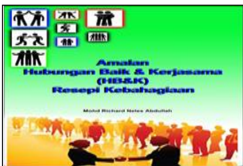
Rajah 1. 'Buku Amalan HB&K Bermanual'

"Buku Amalan HB&K Bermanual" merupakan buku yang ditulis oleh saya berdasarkan sorotan literatur, pengalaman autentik dan sintesis kandungan dilakukan untuk mendapatkan prinsip-prinsip asas amalan hubungan manusia (interpersonal) yang utama. Rajah 1 menunjukkan 'Buku Amalan HB&K Bermanual' yang saya gunakan dalam kajian ini.