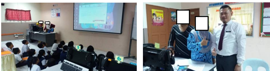
Rajah 10. Aktiviti pengajaran kolaboratif yang melibatkan peserta kajian pada 4 Oktober 2016 (selepas tindakan) (kiri) dan Guru Pembimbing (SK Stapok) memuji tingkah laku pelatih (kanan)