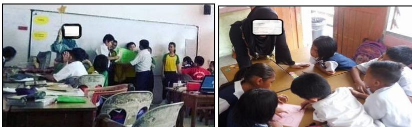
Rajah 9. Endi dan Duwwoh mula mengamalkan hubungan baik

Rajah 9 dan Rajah 10 menunjukkan beberapa contoh amalan hubungan baik dan bekerjasama peserta kajian dan pujian oleh guru pembimbing.