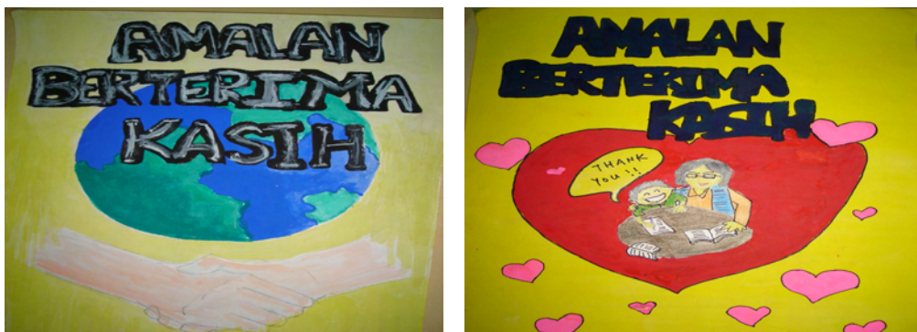
Gambar 1-16. Poster yang dihasilkan pelajar PPISMPMT

Kami juga mengambil tindakan selanjutnya sebagai latihan, pelaziman dan pengulangan amalan nilai berterima kasih dengan mempamerkan semula hasil lukisan mereka yang telah ditukarkan ke format jpeg menggunakan PowerPoint selepas enam bulan. Selepas itu, mereka diberi borang temu bual meminta mereka menghuraikan maksud tersirat di sebalik lukisan mereka dan lambang-lambang yang mereka telah gunakan.