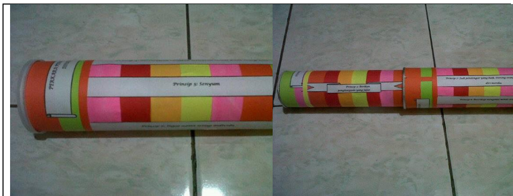
Rajah 1. Kit HB&K dalam mod simpanan (kiri) dan Kit yang sedang digunakan (kanan)

Inovasi pdp ini melibatkan dua komponen utama iaitu, (1) ceramah menggunakan kit HB&K dan (2) melakonkan prinsip-prinsip yang terdapat pada kit secara berkumpulan. Selain memberi kemahiran asas hubungan baik sesama manusia, inovasi ini juga mampu menjadi alat bagi meningkatkan tingkah laku dan amalan nilai bekerjasama. Walau bagaimanapun, peranan utamanya adalah bagi mendedahkan pelajar kepada ilmu kemahiran asas hubungan baik sesama manusia yang menjurus kepada nilai bekerjasama.