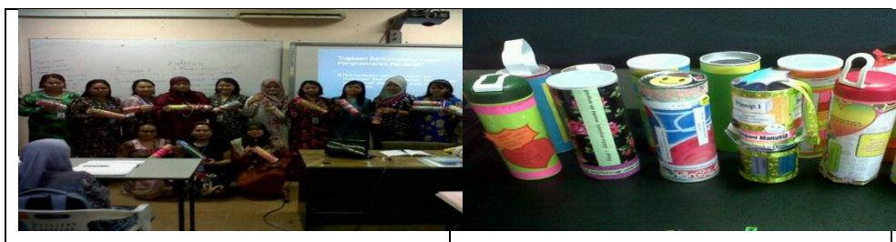
Rajah 6. Sesi perkongsian belajar kemahiran hubungan manusia dan kerjasama dan membina Kit HB&K dengan daya kreativiti sendiri oleh pelajar KDC KDPM dengan bimbingan saya

Rata-rata mereka dalam sesi interaksi mengatakan bahawa mereka akan cuba menerapkan kit HB&K ini di tempat mereka akan mengajar nanti. Bahkan, kedapatan beberapa orang guru pelatih tersebut acapkali mengucapkan terima kasih kepada saya yang menunjukkara kemahiran asas hubungan manusia dan nilai bekerjasama melalui Kit HB&K.