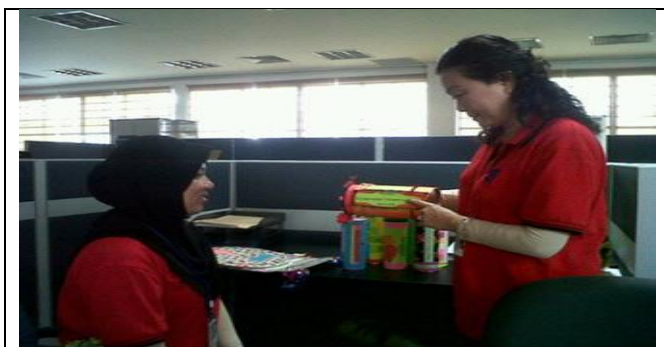
Rajah 7. Pelajar KDC-KDPM (KEMAS) Ambilan November 2013 seronok belajar kemahiran asas hubungan baik dan kerjasama antara manusia menggunakan Kit HB&K

Saya berpuas hati kerana akhirnya, pelajar PISMP (Mentee dan pelajar Elektif Pendidikan Moral) telah melaksanakan aktiviti ini. Perlu juga saya nyatakan bahawa para pelajar saya (guru pelatih) banyak membantu dengan mengemukakan cadangan bernas mereka bagi menambahbaik Kit HB&K saya.