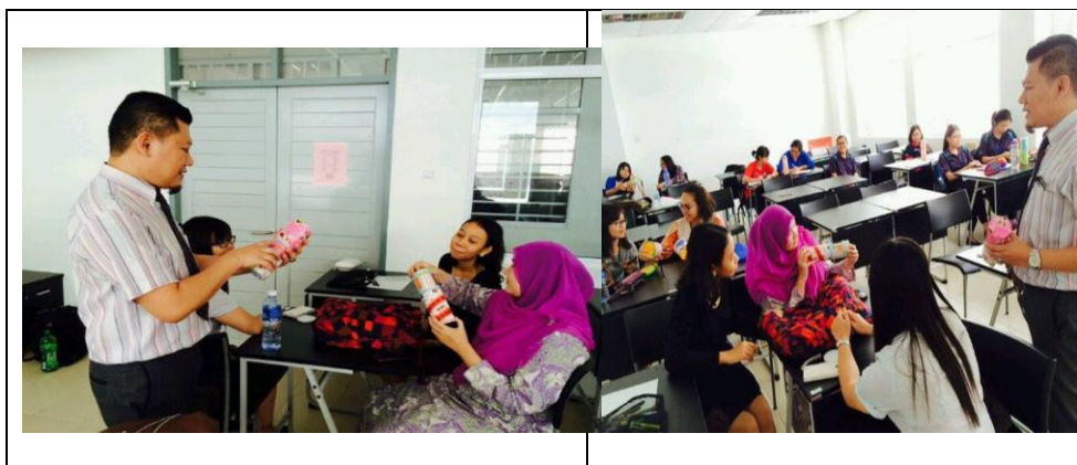
Rajah 3. Saya melaksanakan ceramah menggunakan Kit HB&K dengan: Pelajar PISMP SJKC 1 dan BI SJKC 2 (dua gambar di kiri) dan pelajar KDPM KDC KEMAS (kanan)

Seterusnya pelajar dalam kumpulan masing-masing disuruh cuba melakonkan setiap prinsip bersama dengan rakan sekumpulan mereka.