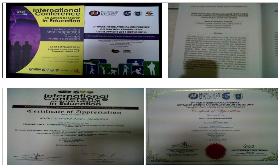
Rajah 8. Muka depan buku program iCARE) 2014 dan ICTLD 2014 (atas kiri), abstrak pembentangan kertas kerja kitaran awal inovasi (atas kanan), sijil pembentangan iCARE 2014 (bawah kiri) dan sijil pembentangan ICTLD 2014 (bawah kanan)

menggunakan Kit HB&K ini pada LDP Perkongsian Ilmu dengan pensyarah-pensyarah, staf bukan akademik IPG Kampus Batu Lintang dan di sekolah-sekolah sekitar Bandaraya Kuching.