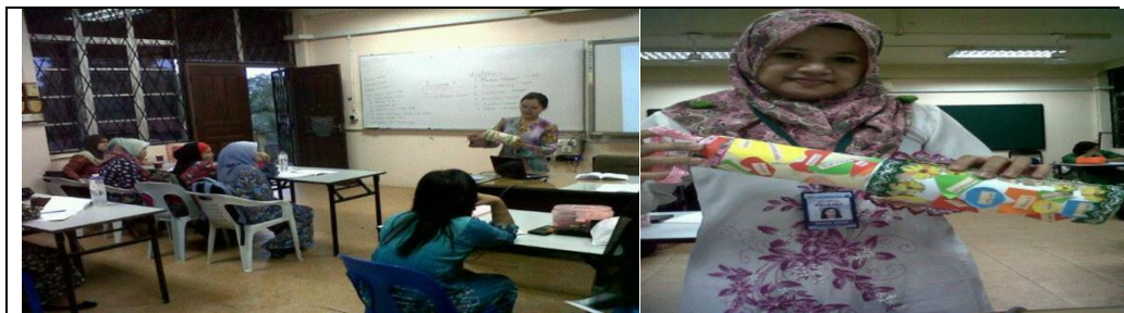
Rajah 5. Perkongsian penggunaan Kit HB&K selepas sesi ceramah penggunaannya bersama pelajar KDPM-KDC (KEMAS)